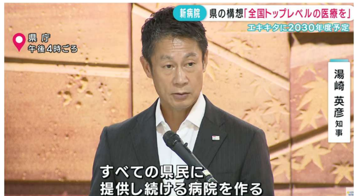
引用：HOME 広島ニュース

広島県は、2030年を目指し、全国トップレベルの高度医療を提供する機能や、医療人材を育成・循環する機能を有する「高度医療・人材育成拠点」として、県立広島病院、JR広島病院、中電病院、HIPRACが一体となり、広島駅の北口（広島市東区二葉の里）に1,000床規模の新病院を整備する予定です。この新病院構想を支えるシステム導入に伴うPMO業務を本共同企業体が担います。